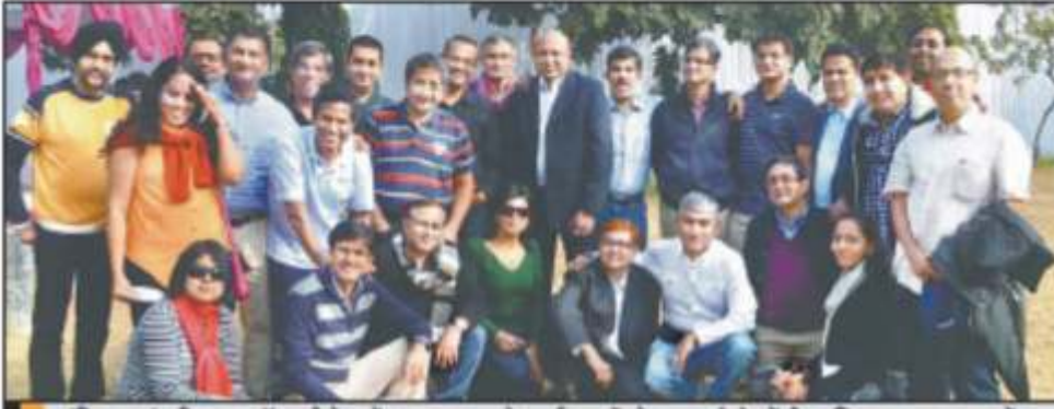
इंडियन इंस्टीट्यूट ऑफ मैनेजमेंट लखनऊ के पूर्व छात्रों ने ग्रुप फोटो में कैद किए यादगार लम्हें।