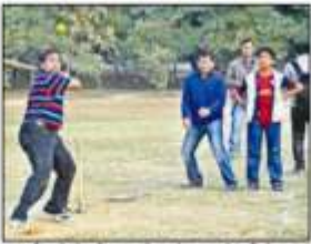
पूर्व छात्रों ने कॉलेज स्पोर्ट्स के साथ खेल विप्रेरित।