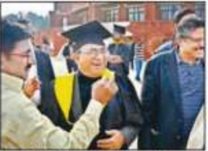
एल्युमनाई मीट में दोनों से मिले दो दिनों के बाद मिले।