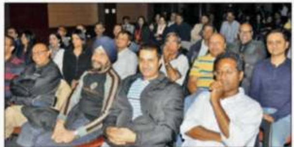
आईआईएम में जुटे 1988 बैच के स्टूडेंट्स ने साझा किए पुराने पल।

■ एनबीटी, आईआईएम : भारती प्रबंध संस्थान में रविवार को शुरू हुई नास्टोलजेलिया में अलमनाई प्याज के आंसू रोने को मजबूर हो गए। ऐसे कठिन टास्क के जरिए उन्हें पुराने साथियों को एंग्रिस जो करना था, सो प्याज छीलना जरूरी था। प्याज के बाद पुराने छात्रों ने टाई बंधकर स्मार्ट इंटरैक्शन भी दिया, जिसमें सभी लोटपोट हुए बिना नहीं रह सके। आईआईएम में नास्टोलजेलिया की मस्ती 24 दिसंबर तक जारी रहेगी।