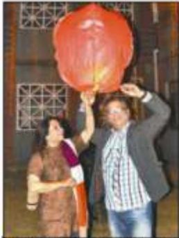
आईआईएम लखनऊ के पूर्व छात्रों के बीच आयोजित कार्यक्रम में छात्रों और पूर्व छात्रों के बीच एक बड़े पैमाने पर एक साथ मिलकर मस्ती करने का कार्यक्रम आयोजित किया गया। कार्यक्रम में आईआईएम लखनऊ के पूर्व छात्रों के साथ-साथ अन्य बैचों के पूर्व छात्रों का भी शामिल होना था। कार्यक्रम में आईआईएम लखनऊ के पूर्व छात्रों के साथ-साथ अन्य बैचों के पूर्व छात्रों का भी शामिल होना था।

नॉस्टैल्जिया (पुरानी यादों)- 2013 का रंगारंग उद्घाटन वर्तमान स्टूडेंट्स के साथ मिलकर पूर्व छात्रों ने उद्गर कैडिल बैलून कैम्पस बेहतरीन बनाने व कमजोर वर्ग के छात्रों की करीने मदद