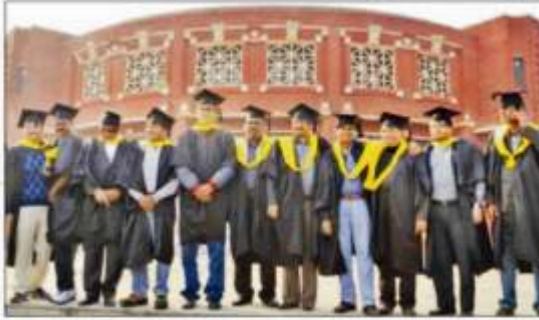
आईआईएम की अलमनाई मीट में जुटे ओल्ड स्टूडेंट्स।