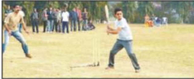
एल्युमनाई ने वर्तमान छात्रों के साथ क्रिकेट में भी हाथ आजमाए।