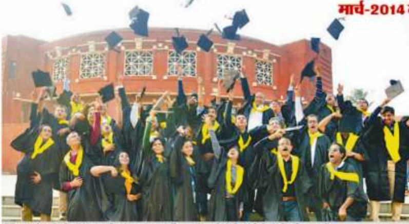
कैम्पस प्रोग्राम में पूर्व छात्रों ने एक बार फिर से ताजा पहचान टंगी... इस में उत्साह और फिर से जिंदगी खरीने की खुशी महसूस की।