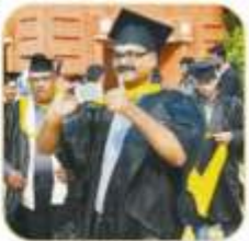
पढ़ाई की कैम्पस में वापस आने की खुशी।

Name of the Publication : Dainik Jagran Edition : Lucknow Date : 25/12/13