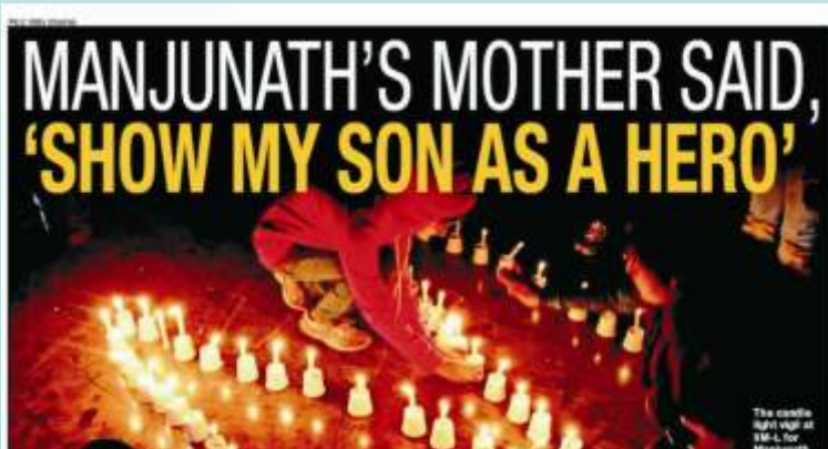
The IM Lucknow stands at the candle light vigil.