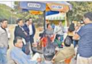
कैम्पस में कैम्पस में वापस आने की खुशी।