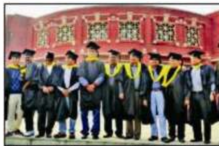
Alumni posing for lensman during reunion event at IIM-Lucknow on Monday

This was followed by a tour of the IIM Lucknow campus for alumni who had missed this event on the first day. The annual general meeting of the Alumni Association